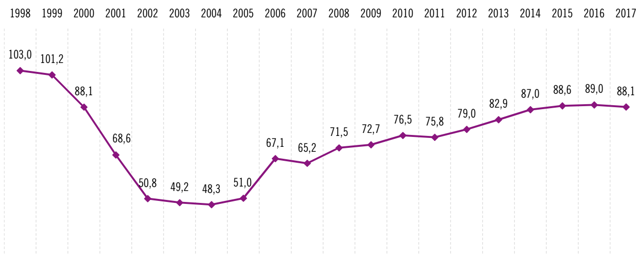
1. grafikoa. Erregularizazio-tasa EAEn. Bilakaera, 1998-2017