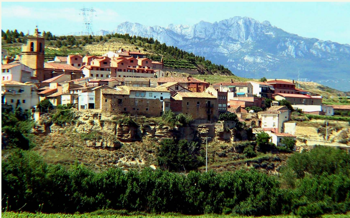
Elkarrizketa. Silbia Grijalba, diseinatzaile grafikoa eta IKT dinamizatzaileria.